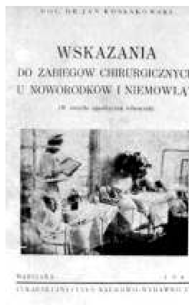
Ryc. 7. Okładka podręcznika J. Kossakowskiego Fig. 7. Cover of J. Kossakowski textbook