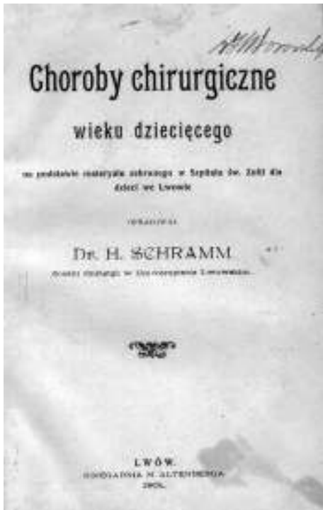
Fig. 2. Cover textbook written by H. Schramm Ryc. 2. Okładka podręcznika H. Schramma