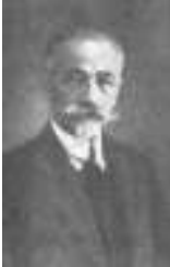
Ryc. 1. H. Schramm Fig. 1. H. Schramm